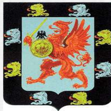
Герб рода Романовых.