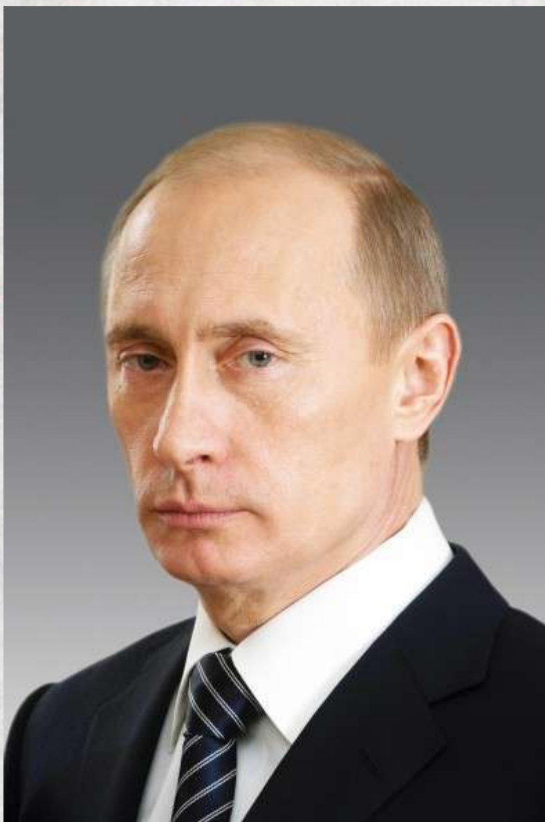
Президент России — Владимир Владимирович Путин